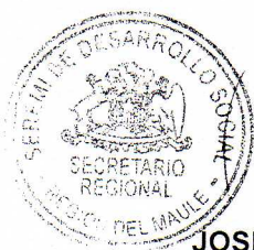
JOSÉ RAMÓN LETELIER OLAVE SECRETARIO REGIONAL MINISTERIAL DE DESARROLLO SOCIAL REGIÓN DEL MAULE