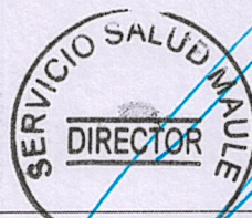
DIRECTOR SERVICIO DE SALUD MAULE