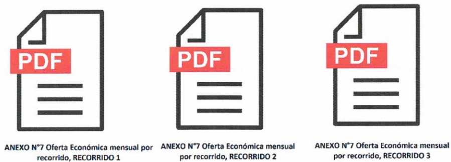
Imagen referencial, ejemplo de postulación y subida del anexo N°7.

La presentación del anexo, se realizará de forma digital, en formato PDF, se deberá adjuntar uno por cada recorrido, la identificación de estos se deberá realizar manteniendo número y título del documento, agregando al final, el número del recorrido a postular.