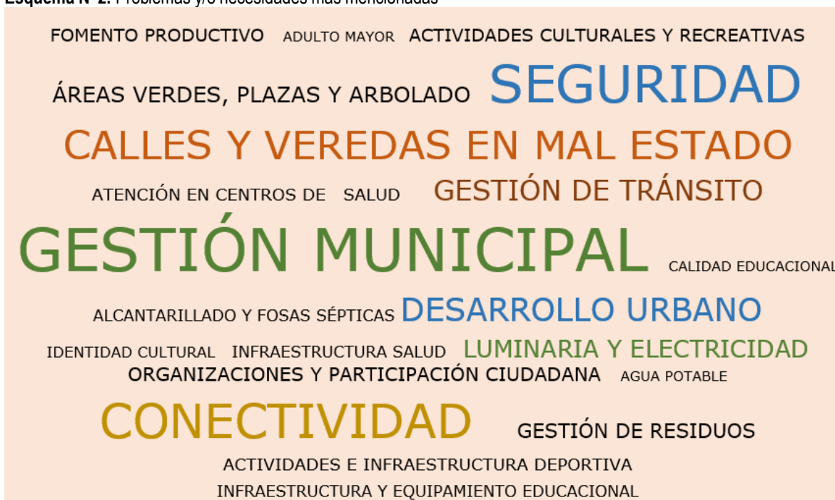
Esquema N°2: Problemas y/o necesidades más mencionadas

El objetivo de posibilitar el planteamiento de problemas y necesidades es evidenciar aquellos aspectos que más afectan a la población en un momento determinado. Se puede apreciar en el esquema a continuación, que, las temáticas más mencionadas por la comunidad fueron: Gestión Municipal, Seguridad, Conectividad, Caminos y Veredas en mal estado, y Desarrollo Urbano, sin embargo, se reflejan otras con un menor número de menciones como: Gestión de Tránsito, Luminaria y Electricidad, Gestión de Residuos, Áreas Verdes, Plazas y Arbolado, Organizaciones y Participación Ciudadana, Fomento Productivo, Actividades Culturales y Recreativas, Atención en Centros de Salud, Actividades e Infraestructura Deportiva, Infraestructura Salud, Alcantarillado y Fosas Sépticas, Infraestructura y Equipamiento Educacional, Identidad Cultural, Adulto Mayor y Calidad Educacional.