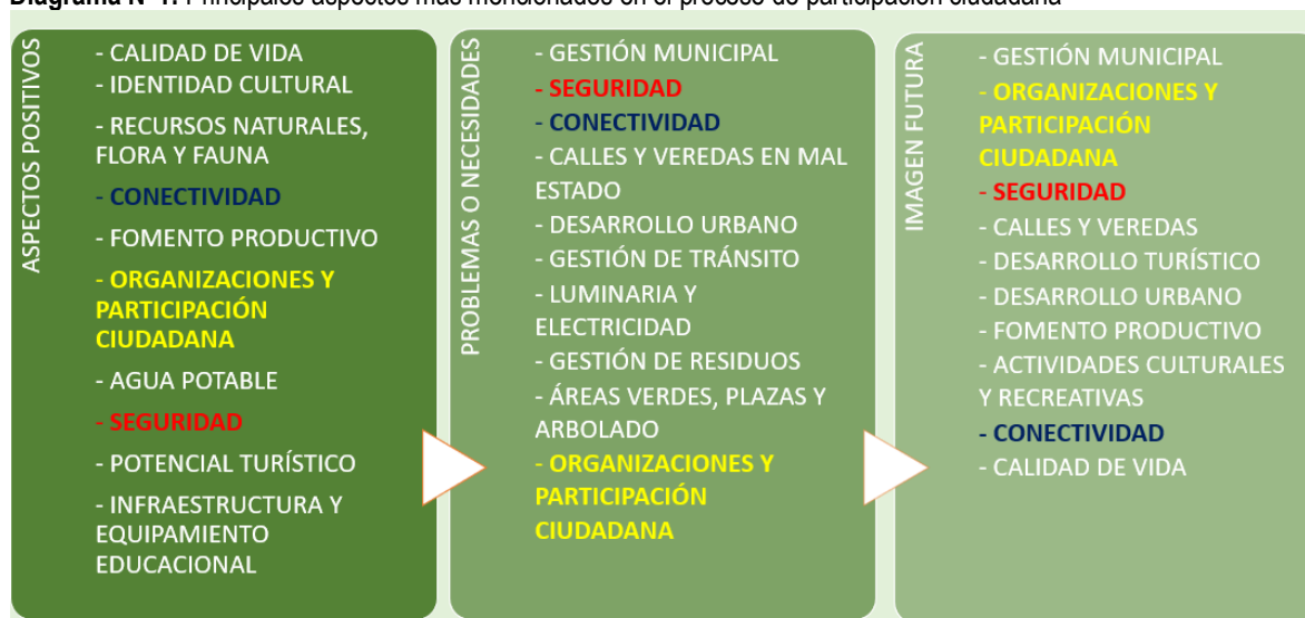
Diagrama N°1: Principales aspectos más mencionados en el proceso de participación ciudadana

Con los principales hallazgos del diagnóstico cualitativo se presenta una síntesis de los aspectos positivos, problemas y necesidades e imagen futura: