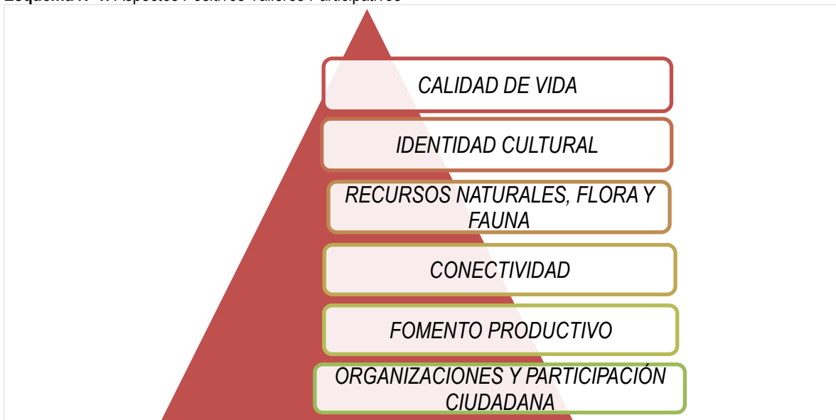
Esquema N°1: Aspectos Positivos Talleres Participativos

En base a los aspectos positivos, se pudo observar que los atributos más destacados de la comuna fueron; i) Calidad de Vida , ii) Identidad Cultural , iii) Recursos Naturales, Flora y Fauna , iv) Conectividad , v) Fomento Productivo y vi) Organizaciones y Participación Ciudadana , tal como muestra la pirámide a continuación en orden descendente.