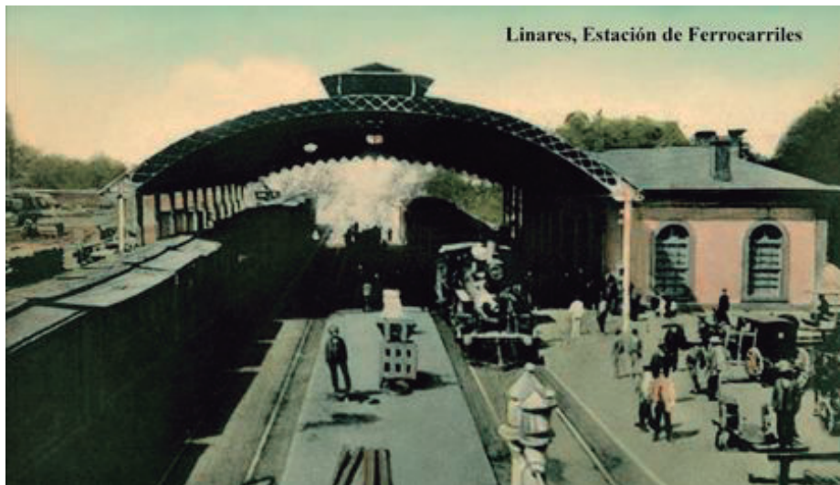
Postal de Estación de Linares, 1930. Enterreno Chile