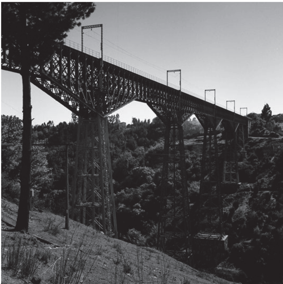
Viaducto del Malleco, 1980.