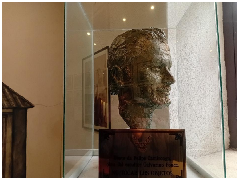
SALA INVENTARIO FELIPE CAMIROAGA