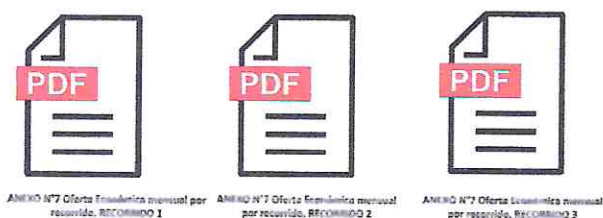
Imagen referencial, ejemplo de postulación y subida del anexo N°7.

La presentación del anexo, se realizará de forma digital, en formato PDF, se deberá adjuntar uno por cada recorrido, la identificación de estos se deberá realizar manteniendo número y título del documento, agregando al final, el número del recorrido a postular.