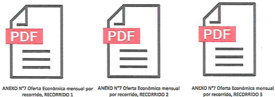
Imagen referencial, ejemplo de postulación y subida del anexo N°7.

La presentación del anexo, se realizará de forma digital, en formato PDF, se deberá adjuntar uno por cada recorrido, la identificación de estos se deberá realizar manteniendo número y título del documento, agregando al final, el número del recorrido a postular.