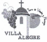
Imagen referencial Oficios entregados: