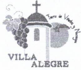
Imagen referencial de rendición de fondos globales transparencia