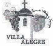
Imagen referencial informe ALFA solicitado