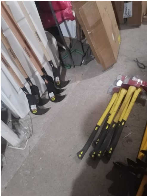
Imagen 1: Ordenando bodega de emergencia y creando inventarios.