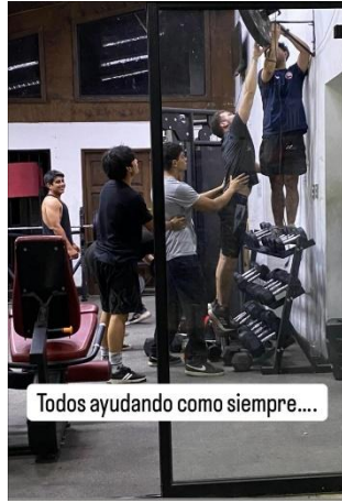
Todos ayudando como siempre....