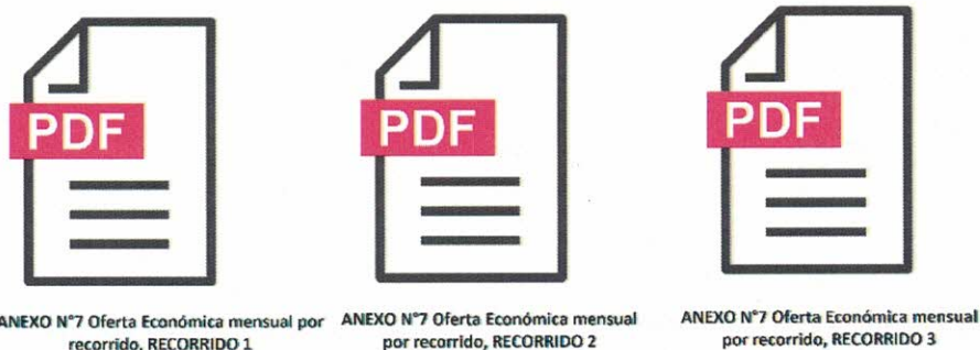
Imagen referencial, ejemplo de postulación y subida del anexo N°7.

Los valores se expresarán en moneda de curso legal (pesos), no incluyendo impuesto. Sin perjuicio de lo anterior, en caso de ser procedente alguna rebaja o franquicia tributaria, el oferente deberá especificar claramente su procedencia y adjuntar los documentos que la acrediten.