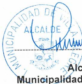
Alcalde Municipalidad de Villa Alegre