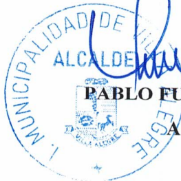
PABLO FUENTES VALLEJOS ALCALDE