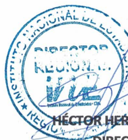
HÉCTOR HERNÁN BECERRA MORIS DIRECTOR REGIONAL INSTITUTO NACIONAL DE ESTADÍSTICAS REGIÓN DE MAULE