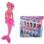
Muñeca sirena con luz, 9 pulgadas, Aleta articulada, variedades.