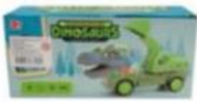
Camión de retroexcavadora o transporte, para niños, a pila y luz.