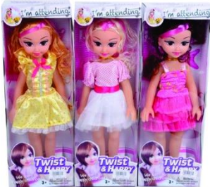
Muñeca de 14 centímetros con trajes variados y con música.