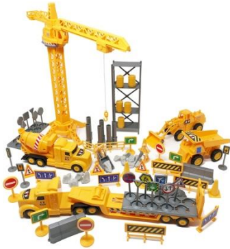
Juego de 16 piezas para proyectos de construcción y vehículos, paquete variado de juguetes de construcción, automóviles, vehículos y accesorios de juguete para niños pequeños.